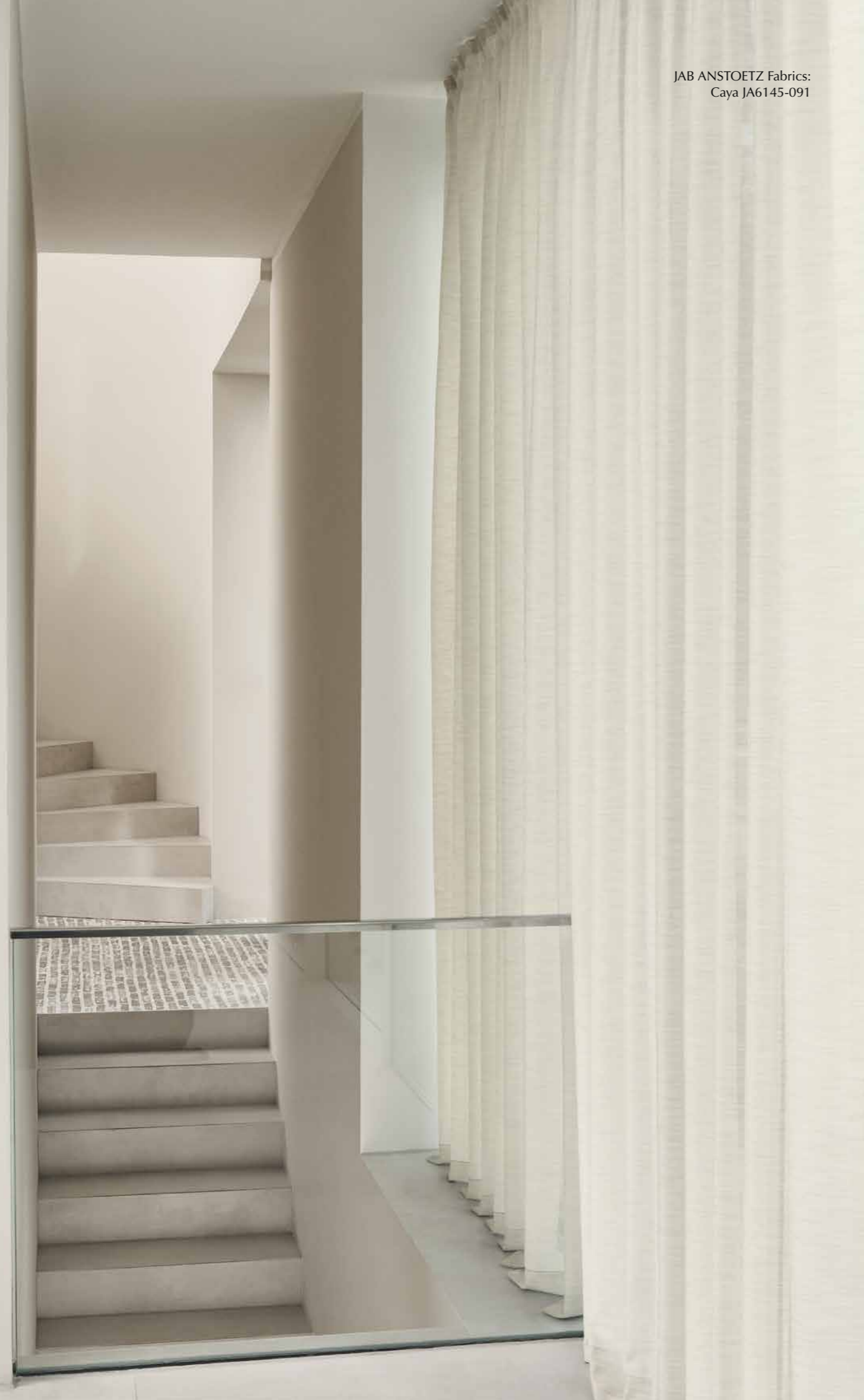
JAB ANSTOETZ Fabrics: Caya JA6145-091