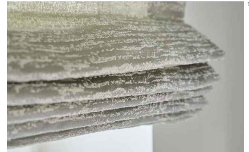
1 JAB ANSTOETZ Fabrics: Arlan JA7115-091