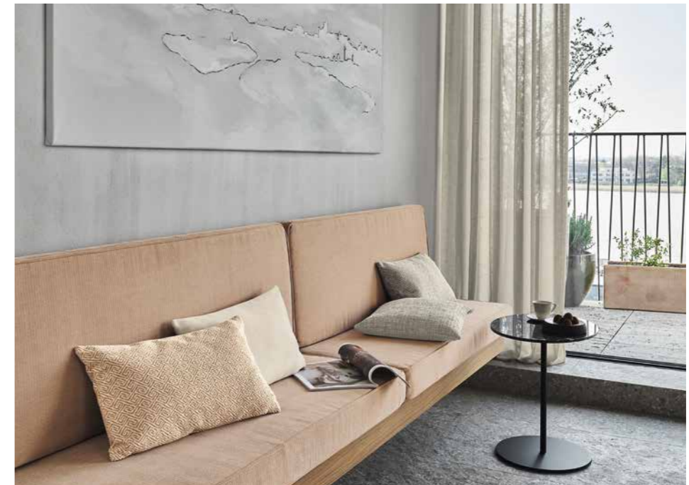
1 JAB ANSTOETZ Fabrics: Echos JA6133-092 Paul JA6150-020 Revival JA2118-051

ip design: Soulmate IP-141-4000 Soulmate IP-141-3001