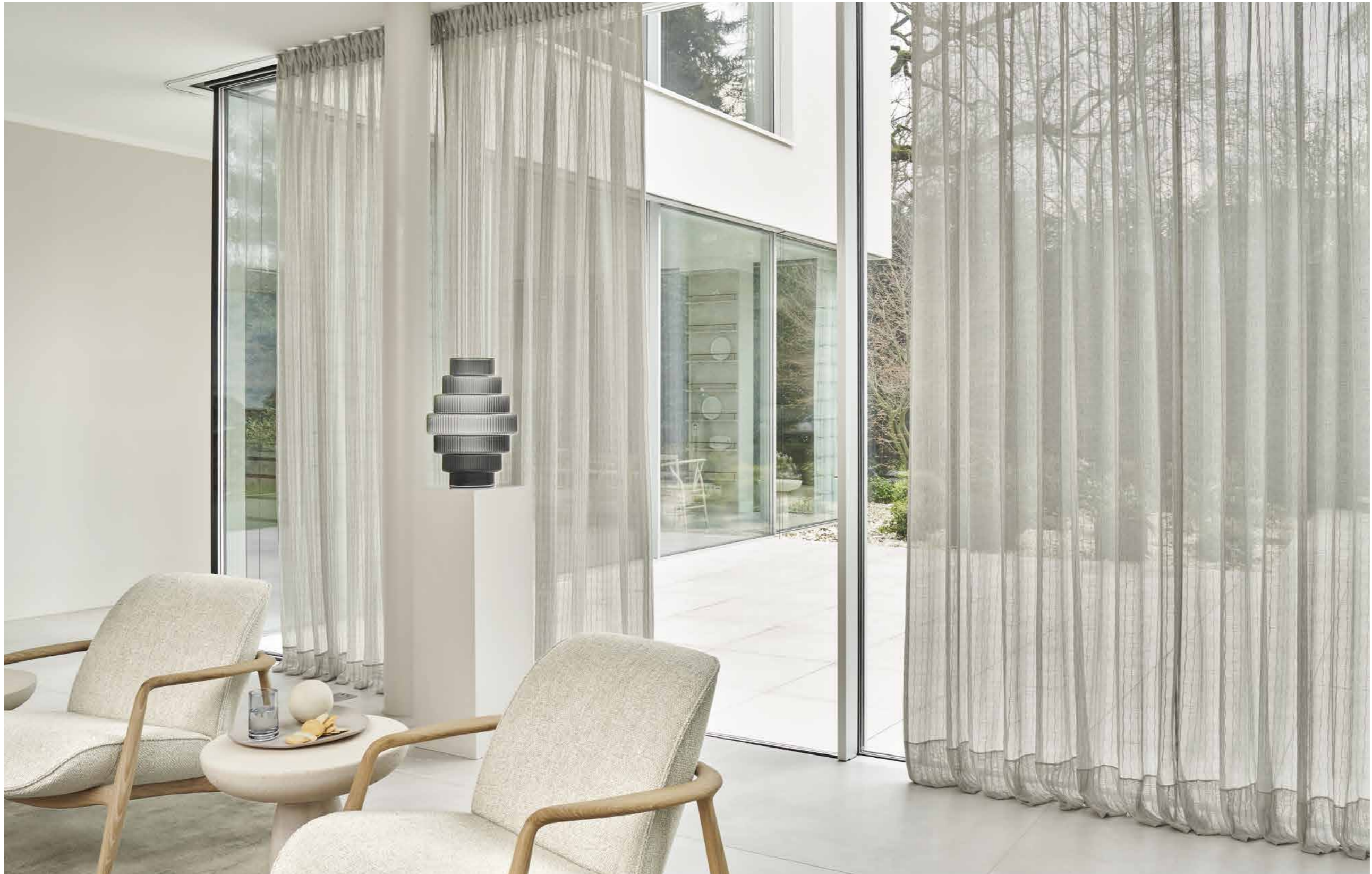
JAB ANSTOETZ Fabrics: Pleats JA6144-091 Chill JA1026-071