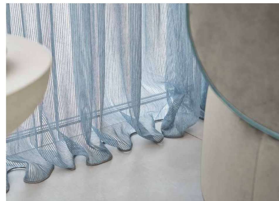
1 JAB ANSTOETZ Fabrics: Jasko JA6143-050 Star JA3016-051, 093 BW: Nimbo BW-186-1000