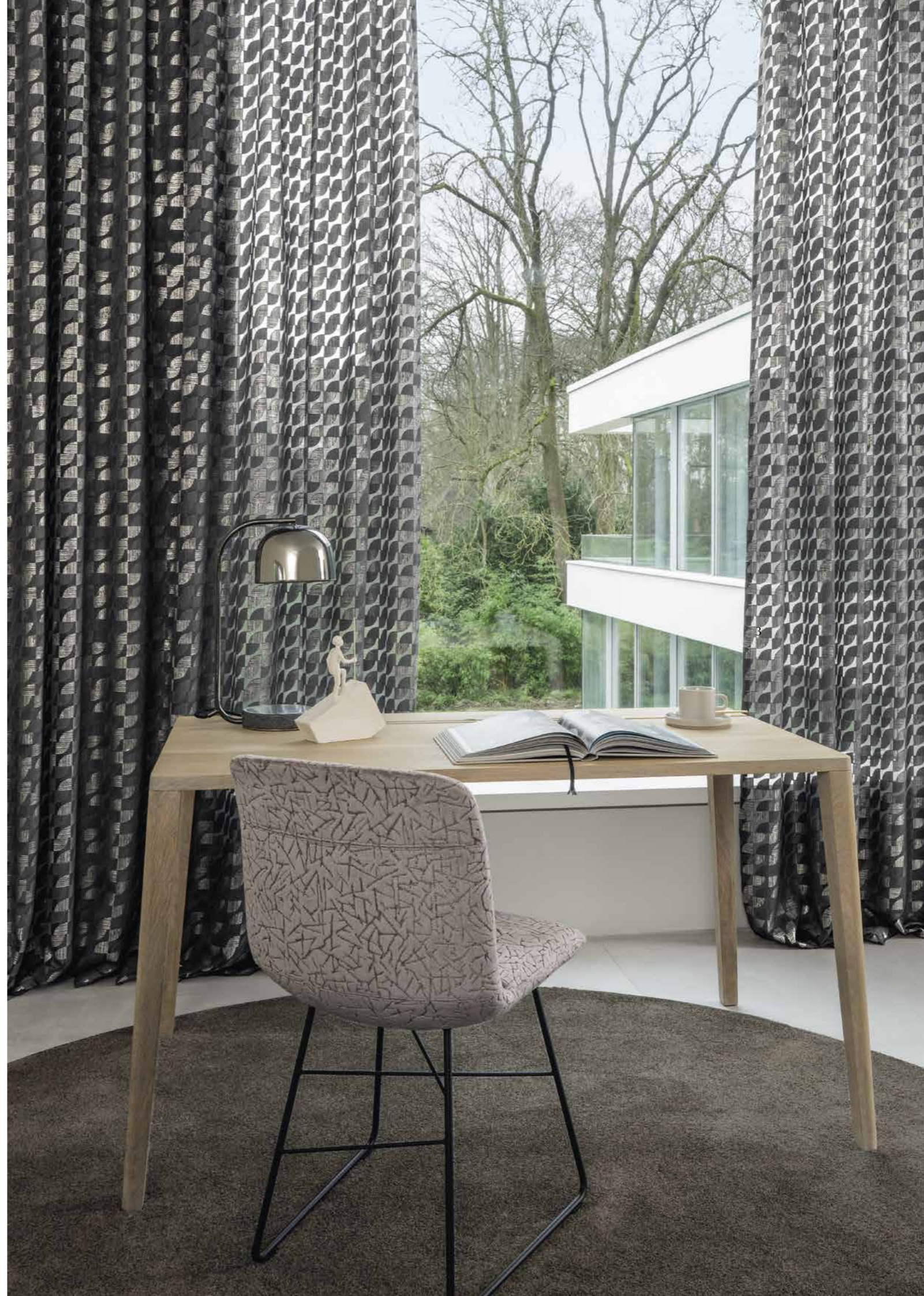
1 JAB ANSTOETZ Fabrics: Solaire JA8069-092