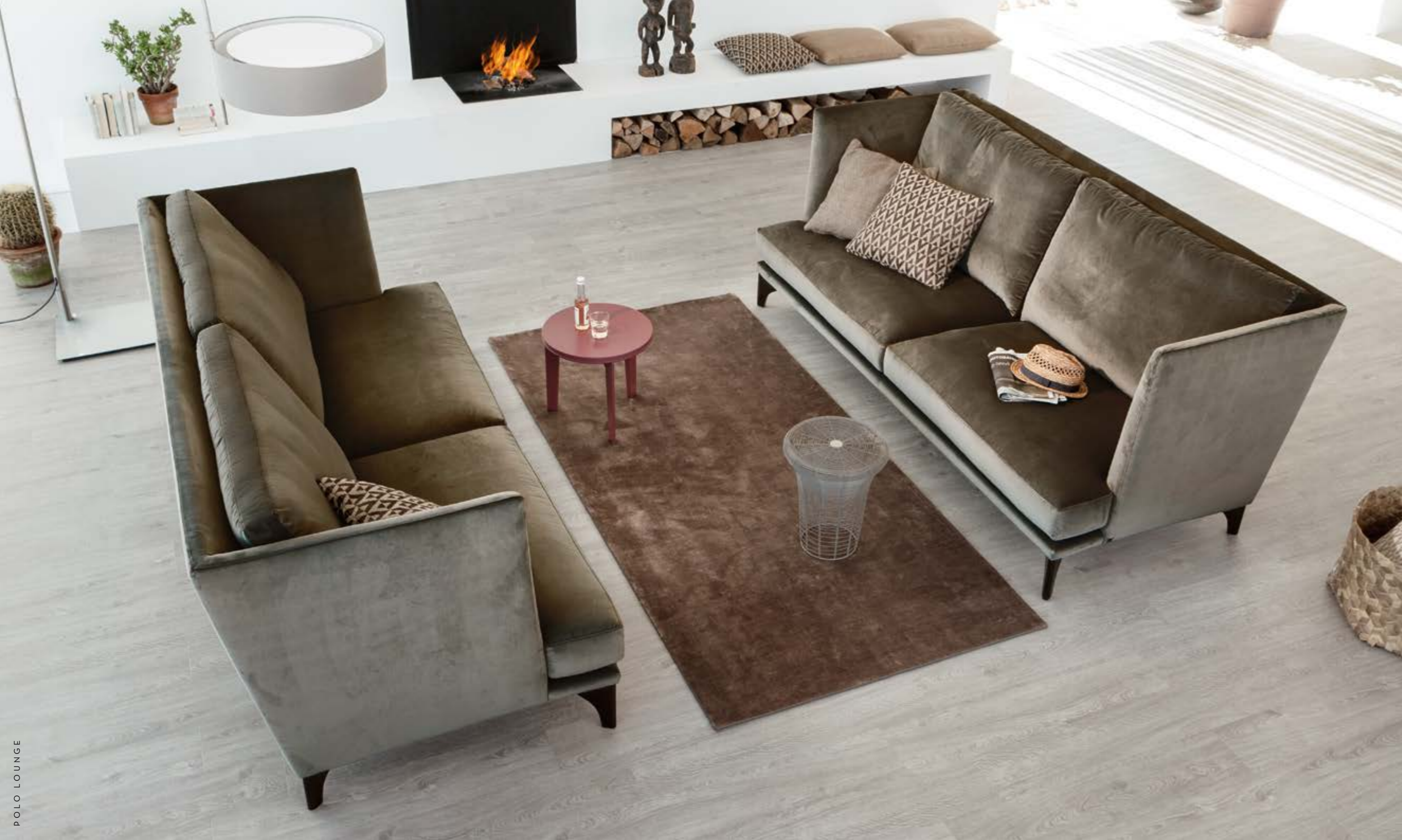
POLO LOUNGE So elegant kann Geborgenheit sein.