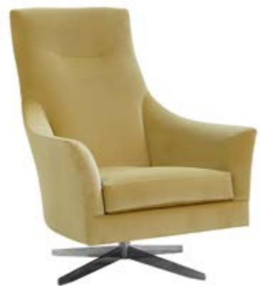
SALONI Charmante Stücke

The flowing armrests of this light three-piece suite are reminiscent of wings. Radiating masculine elegance and, with carefully coordinated proportions, a modern sense of comfort, you'll be eager for these pieces to take up residence in your living room or stately study. The fold-out neck support also provides unrivalled comfort as you read, converse or simply sit back and relax.