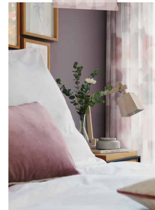
KALEIDOSCOPE 8-4986-060 MILO 8-3153-097, -091, -080, -067, -060