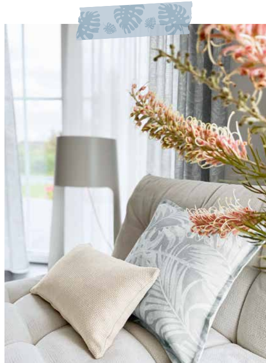
LA PALMA 8-1917-050, -020 CORTINA 8-4975-090 PANAMA 8-3169-072