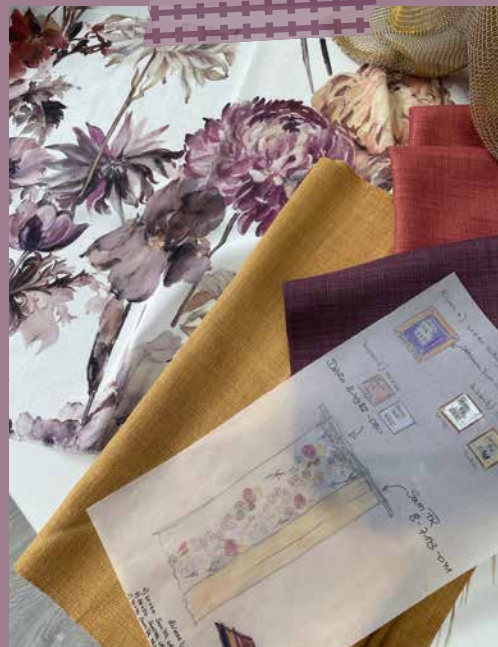
DAHLIA 8-4982-080 SAM FR 8-7143-080, -084, -062, -041