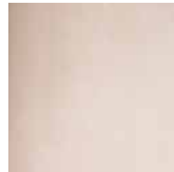
Glassäule glass columns