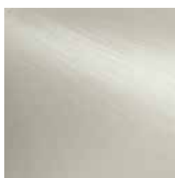
Nickel matt matt nickel